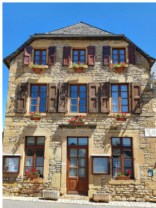
Monsieur le Maire, Raphaël BACH

lundi, mardi, jeudi : 12h30 - 17h 1 mercredi sur 2 : 9h00 - 12h00 fermé le vendredi