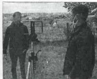
Reportage avec les habitants.

Ces premières pistes de projet de territoire pour l'écriture du Contrat de relance et de transition écologique seront basées sur l'analyse des études existantes et sur la parole des habitants.