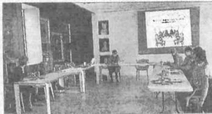
Le groupe en pleine séance de travail.

Le 26 mai 2021, le nouveau « groupe personnes-ressources » a été lancé avec la commune de St-Geniez-d'Olt à la mairie dans le respect des mesures sanitaires, en présence d'une