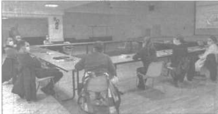
La réunion du PETR s'est déroulée à la salle d'animation d'Estaing.

Depuis 2019, le Pôle d'Équilibre Territorial et Rural du Haut-Rouergue mène une politique d'accueil pour les nouveaux arrivants sur son territoire afin de répondre aux enjeux démographiques de demain en Haut-Rouergue. Cette mission englobe plusieurs axes de travail dont celui de la culture de l'accueil « Comment bien accueillir sur un territoire ? ».